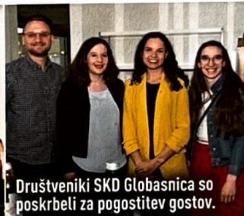
Društveniki SKD Globasnica so poskrbeli za pogostitev gostov.