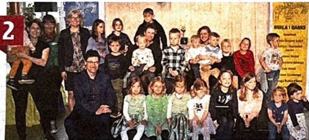
Auch zahlreiche Kinder waren beim Benefizabend in Globasnitz dabei